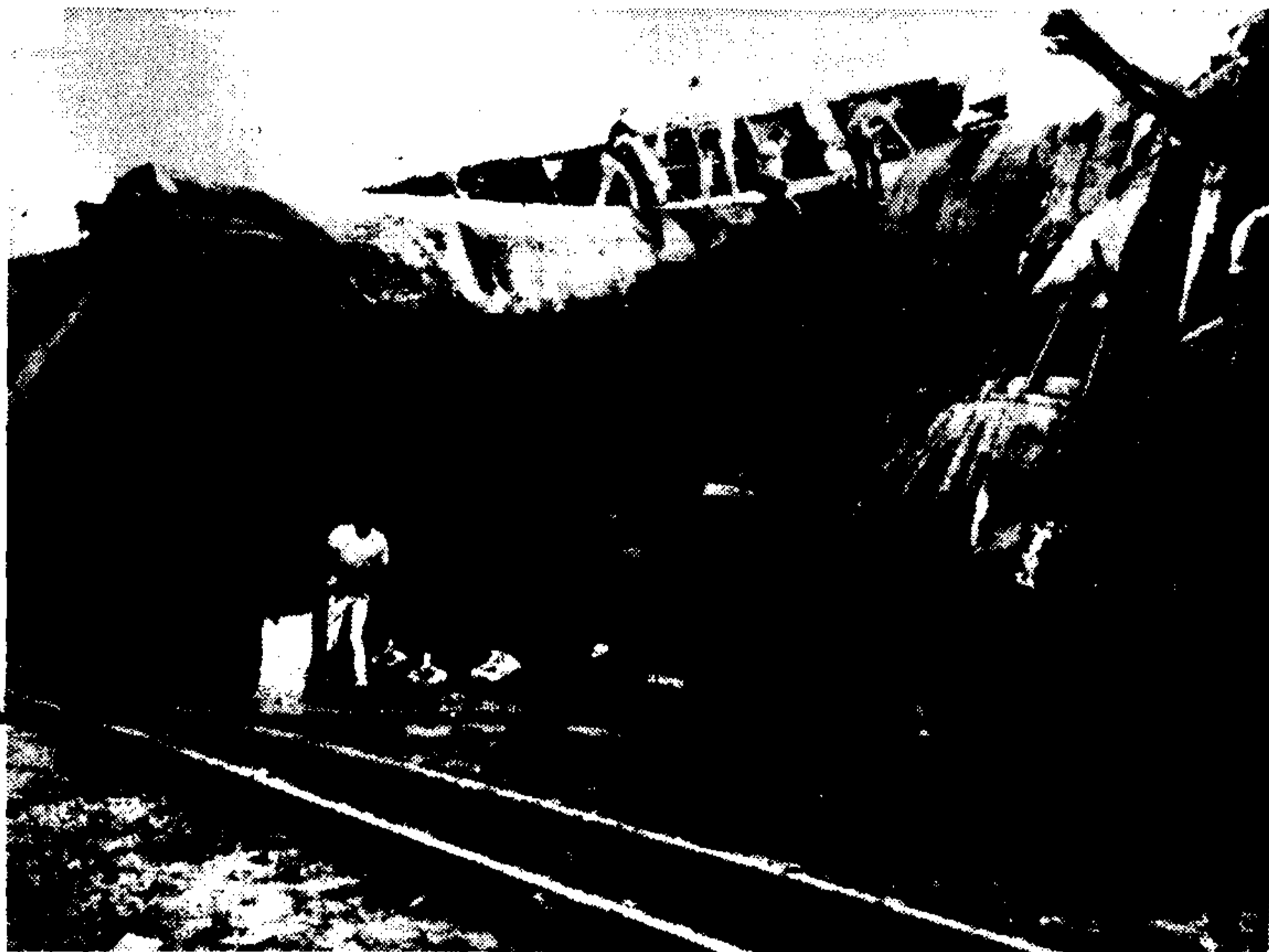
Από το φοβερό σιδηροδρομικό δυστύχημα, που συνέβη χθές στο Μεξικό — ένα από τα χειρότερα στην ιστορία της χώρας αυτής. Νεκροί 149 τουλάχιστον, τραυματίες 781, 81οι σκαφών προοκύνηται.